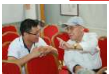
董事长与抗战老兵▲