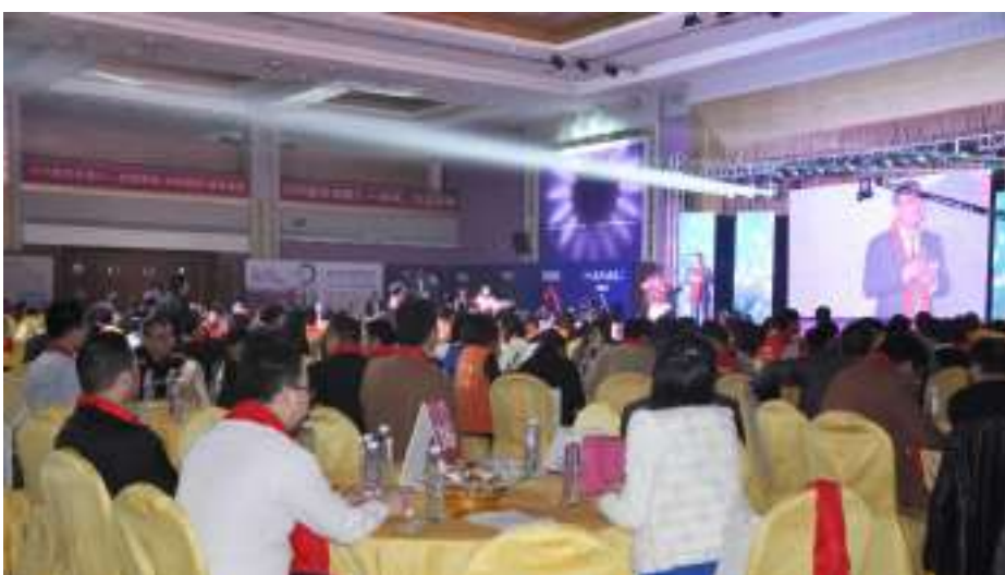
2015年博天国际感恩年会 ▲